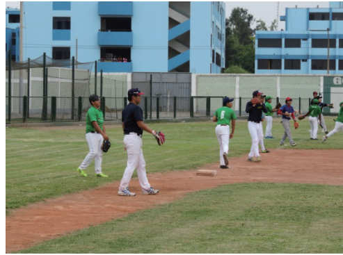
写真5 地元選抜チームに指導する近大野球部の短期ボランティア（チーム派遣）

が、マラスと呼ばれる犯罪者集団（ギャング）による犯罪が相次いでいる。政権の課題は治安の改善及び経済の活性化。政策の重要分野を雇用、教育、治安に置いている。