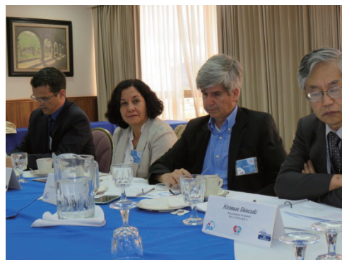
写真3 JICA、調査団、教育省、スポーツ省、野球連盟との協議