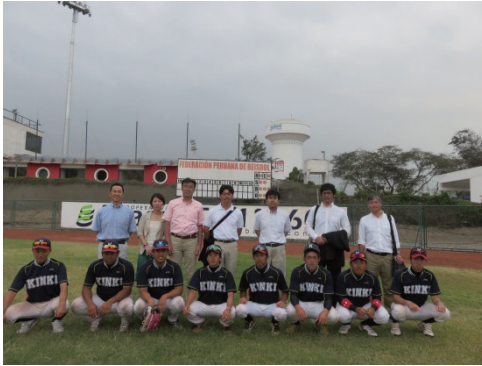
写真6 調査団と近大野球部短期ボランティア