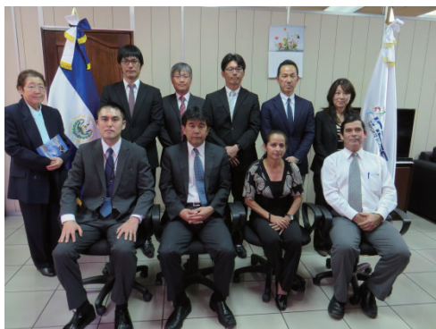
写真10 調査団とスポーツ庁の協議