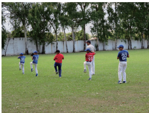
写真8 エルサルパドルの少年野球チームの練習風景