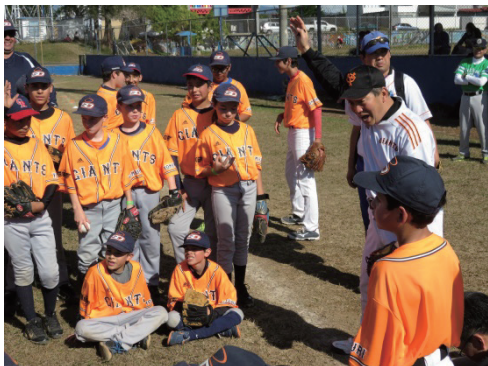
写真2 サンドミンゴの少年野球チームへのジャイアンツメソッドの講習会