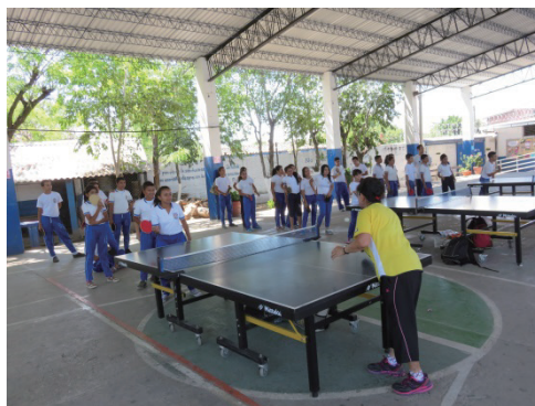
写真9 チーム派遣の短期ボランティアの卓球巡回指導風景