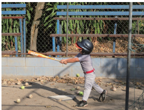
写真7 硬球を打つエルサルパドルの野球少年（4歳）