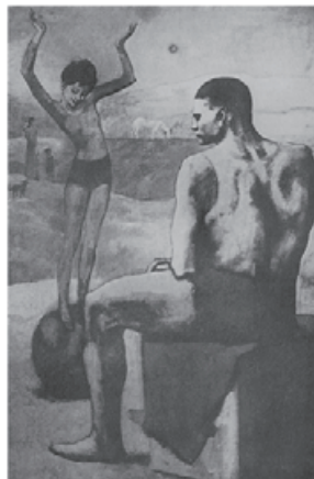
図 12 Picasso, The Wandering Acrobats