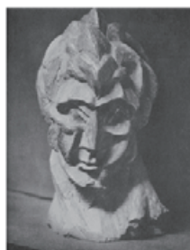
図 18 Picasso, Sculpture