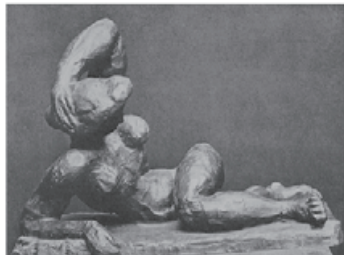
図 10 Matisse, Sculpture