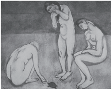
図 7 Matisse, Untitled ( Bathers with a Turtle )