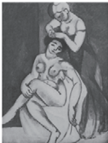
図 9 Matisse, Hair Dressing