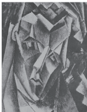
図 13 Picasso, Untitled