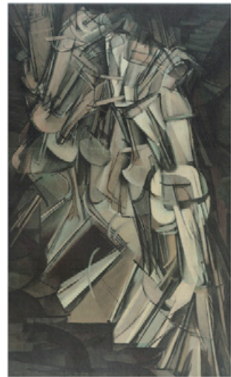
図 19 Duchamps, Nude Descending a Staircase, No. 2

この時代精神は、美術界においても時間の概念を揺るがしていた。たとえば、アーモリー・ショウで注目を集めたマルセル・デュシャン (Marcel Duchamp 1887-1968) の『階段を下りる裸婦像, No. 2』 ( Nude Descending a Staircase, No. 2 , 1912) (図 19, Kushner and Orniccutt, eds. 204) が、人物の動きという連続する時間性を二次元の画面に取り込んだことはひとつの革命であった。またマーガレット・ドゥコーヴェン (Margaret DeKoven) が指摘するように、多角的視点をひとつの画面に表現した初期立体派の同時性とスタインの「継続的現在」を、それぞれのジャンルの時間概念を超越する試みとして比較対照することもできるだろう (152)。一時性に封じ込められてきた絵画にとって時間の持続性や多時性の獲得が革命的だったように、スタインの「継続的現在」は文学上の時間性を転覆しようとする野心的な試みであった。こうしてスタインは新しい世紀の精神をとりこんで、文学媒体における時間概念に挑戦した。その試みは、差異を含んだ連続する今を綴ることで時間の枠組みを無化し、生き、動き、反復する人間の「本質」を捉えようとしたのである。