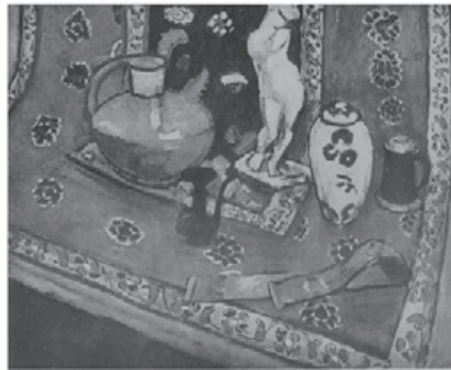
図 8 Matisse, Untitled ( Still Life in Venetian Red )