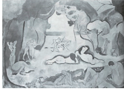
図 6 Matisse, The Joy of Life