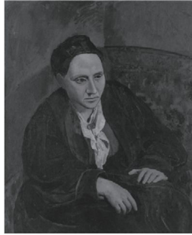
図4 Picasso, Portrait of Gertrude Stein

ンが急速に交友を深め、画家が彼女の肖像画を描くのは1905年から1906年にかけてのことである(図4, Bishop, Debray and Rabinow, eds. 222)。スタインがピカソのアトリエに足繁く通ったことは『アリス・B・トクラスの自伝』( The Autobiography of Alice B. Toklas , 1933; 以下『自伝』)に伝説化されている(45-57) 6 。やがて長兄マイケルとその妻がマティスの、スタインがピカソのそれぞれ主要パトロンとなり、スタイン一家はパリにおける前衛モダニズム絵画の発展に大きく貢献することになる。しかし画業において報われなかったレオは彼らの作風に関心を失い、作家として注目を集めつつあったスタインとの溝も深まり、1913年にパリを去る 7 。こうして、第一次世界大戦が状況を一変させるまでに、フルールス通のサロンの主導権はレオからスタインに移り 8 、彼女はモダニズム美術の発展史に大きな足跡を残すことになった。