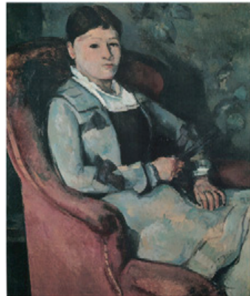
図3 Cézanne, Madame Cézanne with a Fan

スタインが「マティス」と「ピカソ」を執筆したのは1909年、両作品が世に出たのは1912年である。まず、この歴史的な文脈を確認しておこう。裕福なアメリカのユダヤ系中流家庭に生まれ、ハーヴァード 4 、ジョンズ・ホプキンス大学で学んだスタインが、兄レオ(Leo Stein 1872-1947)の住むフルールス通(rue Fleurus) 27番地のアパートマンに身を寄せたのは1903年のことである。スタインは当時画家を志していたレオの手ほどきで前衛美術に出遭い、兄妹は後期印象派のゴーギャン、ルノワール、セザンヌ、ロートレック、マネ、ドガらの作品を購入した 5 。1904年にはセザンヌの『扇を持ったセザンヌ夫人』( Madame Cézanne with a Fan , 1881-82)(図2, Giroud 12)を、1905年にはサロン・ドートンヌで一大スキャンダルとなったマティスの『帽子を被った女』( Woman with a Hat , 1905)(図3, Giroud 13)、そしてバラ色の時代のピカソの作品を購入し始める。ピカソとスタイン