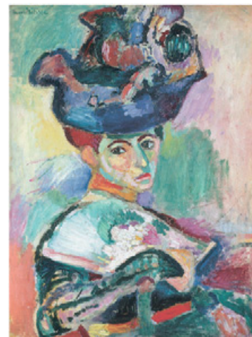
図3 Matisse, Woman with a Hat