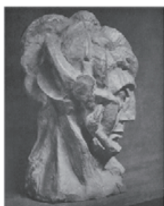
図 17 Picasso, Sculpture