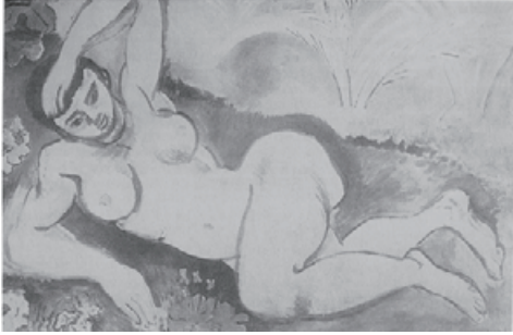
図 5 Matisse, Untitled ( Blue Nude—Souvenir de Biskrâ )

法が進化をみせる『デッサン [裸婦]』(1910) (図 16)、彫刻(フェルナンドの頭部)(1909)の正面と側面の写真(図 17, 18)が掲載された(653-59) 13 。これらの図像に続けてスタインのテキストは紹介されたのである。それはスティーグリッツがプロデュースしたマティス、ピカソ、スタインの競作、というヨーロッパの新しい芸術的動向をアメリカの読者に知らしめた誌上展覧会であった。