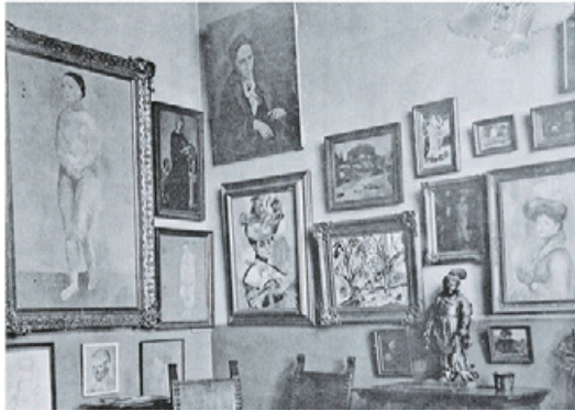
図1 rue Fleurus 27, ca. 1907

ガートルード・スタイン (Gertrude Stein 1874-1946) の来歴は幾重もの越境によって構成されている。パリに住むアメリカ人、西洋社会におけるユダヤ人、男性的レズビアンとして、彼女は国籍、宗教、ジェンダー、セクシュアリティの境界に位置していた 1 。スタインは作家として認知を得る以前から現代美術収集家として名を馳せ、新しい時代の美術や文芸を支援し奨励するパトロンとして大きな役割を果たした。現代美術作品が展示されたパリのスタインのサロン 2 では、様々な国や分野のモダニズム芸術家たちが美術や音楽や文学などを語り合