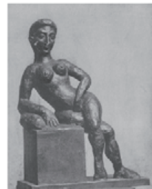
図 11 Matisse, Sculpture

Sant Joan)をピカソはオルタ・デ・エブロ(Horta de Ebro)と呼んでいる。“Pablo Picasso. The Reservoir, Horta de Ebro (Horta de San Joan, Summer 1909).”