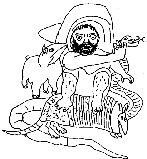
図 3 ソンプレロン

トホラバルの間では、キキナル (k'ik'inal, 黒いものの世界) という地下世界の支配者はニワン・プクフ (niwan pukuj, 大悪魔) と呼ばれる。この支配者は、ニワン・ウィニック (niwan winik, 大きな人間), ソ